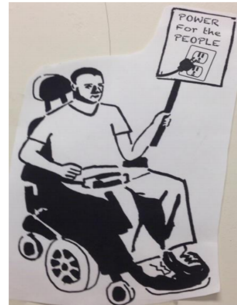
Poder para la Gente