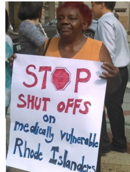
Frente a la corte superior, antes de llenar la demanda