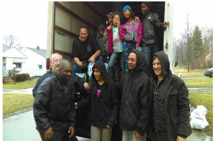
Frente a el camión que manejamos a Flint, MI, entregando agua y solidaridad de parte de RI