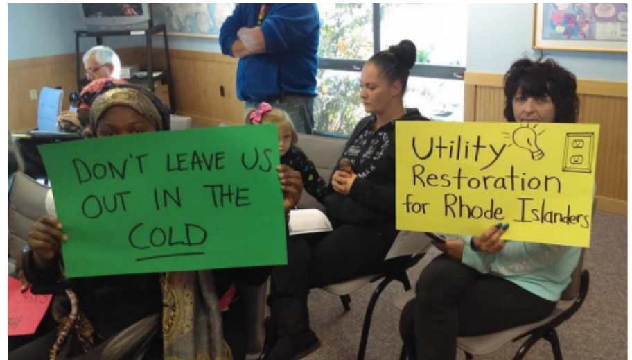
Dentro de una audiencia de GWC de Propuesta de Regulación Restauradora en el PUC (comisión de utilidades públicas), Warwick